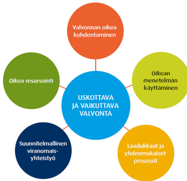
Kuva 2. Tavoite: pelastuslaitoksen valvontatoiminta on yhdenmukaista, uskottavaa ja vaikuttavaa (Pelastuslaitosten valvonnan aapinen; Suomen Kuntaliitto, 2018)

Uskottava ja vaikuttava valvonta koostuu valvonnan oikeasta kohdentamisesta ja oikean menetelmän käyttämisestä, oikeasta resursoinnista ja osaamisesta sekä laadukkaasta käytännön toteuttamisesta. Valvontatoiminnan tulee sisältää suunnitelmallista viranomaisyhteistyötä. Valvontatehtävät tulee hoitaa hyvää asiakaspalvelua noudattaen.